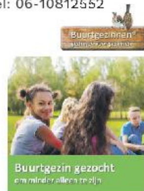
Buurtgezin gezocht om minder alleen te zijn

Lieke van der Heijden (Buren) via lieke@buurtgezinnen.nl of bel: 06-10812552