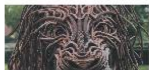
Heb jij lef? P2