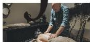
Complete wellness belevens P5