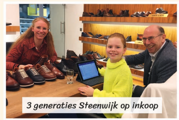
3 generaties Steenwijk op inkoop

Rijksstraatweg 134 3956 CT Leersum 0343 - 451434 info@steenwijk-schoenmode.nl steengoeieschoenen.nl steenwijk-schoenmode.nl facebook.com/steenwijk.schoenmode