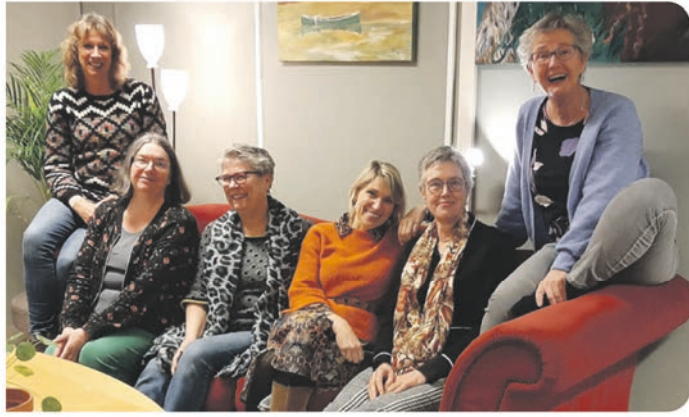
Werkgroep vrouwendag Rhenen

Vrouwendag wordt in Rhenen elk jaar groot gevierd. Dit jaar was de opkomst weliswaar iets minder dan voorgaande edities, maar met ca. 80 vrouwen was het toch erg gezellig. De locatie De Westpoort blijkt een uitstekende locatie om Vrouwendag in Rhenen te vieren.