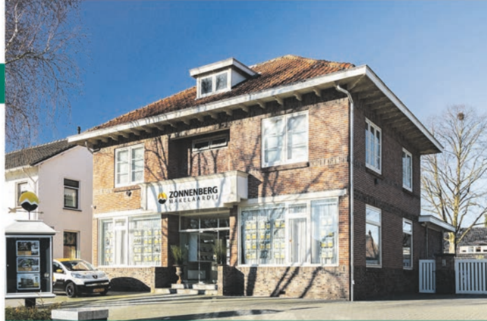
Kantoor te Veenendaal.

Desalniettemin valt op dat er maar weinig te koop staat voor 'doorstromers'. Wie een zoekopdracht op Funda heeft aangemaakt merkt op dat er weinig nieuw aanbod