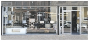
Paradijs met betaalbare meubelen P4