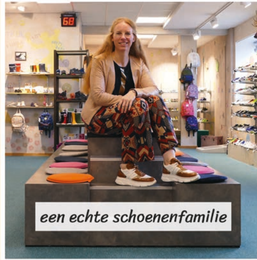
een echte schoenenfamilie