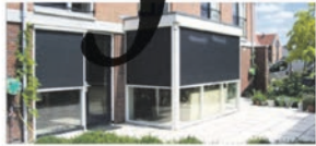
Van den Hatert verhuist naar nieuw pand P12