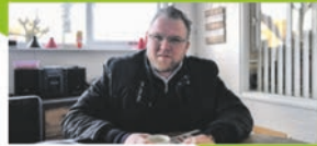
Nieuwe krant brengt lokale ondernemer dichterbij P13

Gemeente Neder-Betuwe | Gemeente Rhenen Ingen | Lienden | Ommeren