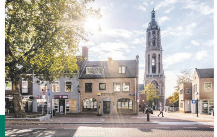
Kantoor te Rhenen.

binnenstroomt op de Rhenense huizenmarkt. Of is dit gegeven niet juist? De snelheid waarmee woningen verkocht worden, maakt dat verkopers en makelaars er steeds vaker voor kiezen woningen eerst in de 'Stille Verkoop' te plaatsen. De woning is in deze periode te koop, alleen buiten het zicht. Dus geen Fundaplaatsing en bord in de tuin. Het voordeel hiervan is dat de verkoper de tijd heeft om iets nieuws te zoeken of te wachten op oplevering van gekochte nieuwbouw en de makelaar alvast kan beginnen met 'matches' maken. Een win-win situatie in deze turbulente huizenmarkt.