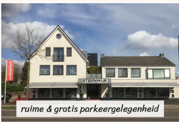
ruime & gratis parkeergelegenheid

Onze openingstijden: ma 13.00 - 18.00 di t/m do 9.30 - 18.00 vr 9.30 - 21.00 za 9.30 - 17.00