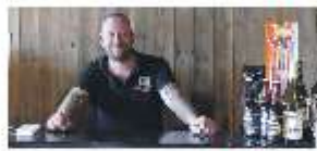
BBQ and Booze P6