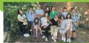
Nieuws van uit het Taalcafé P10

Gemeente Neder-Betuwe | Gemeente Rhenen Ingen | Lienden | Ommeren