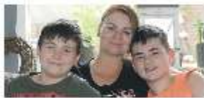
Drie vechters P4