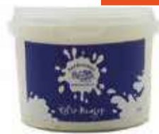
Aerderoort Boerenzuivel Kéfir 1 liter