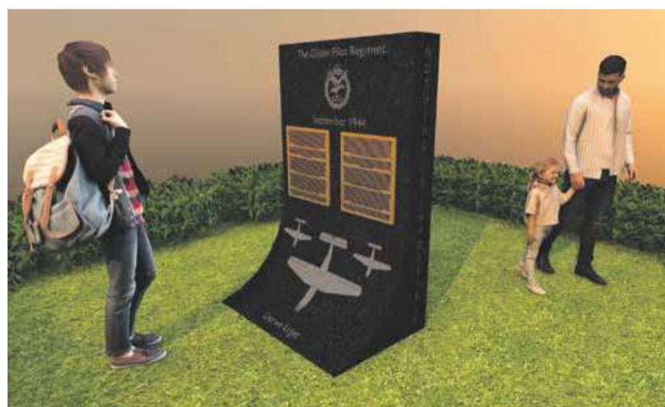
impressie van het monument

Het monument wordt, zoals het er nu uit ziet, in september 2021 geplaatst en komt bij de Horsa Glider en steen die opgesteld staan ter herinnering aan de Horsa landingen bij de ingang van camping Lindenhof en de Glider Collection in Wolfheze (Wolfhezerweg/Sara Mansveltweg). Veel mensen denken dat de bank bij de spoorovergang in Wolfheze een monument is voor de gliderpiloten en hun regiment maar dat is niet zo. De Glider Pilot Regiment Association (het regiment werd in 1942 opgericht en in 1957 opgeheven) heeft de bank jaren geleden geadopteerd. Zondags, na