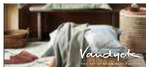
Vandyck Experience store P5-8