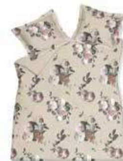
2. ELEGANT CHAMPAGNE