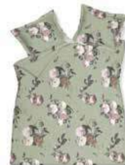
1. ELEGANT SMOKE GREEN

1. & 2. Satijnen overtrekset ELEGANT in de kleuren Smoke green en Champagne - 1-persoonsset 79,95 | 64,95 - 2-persoonsset 149,95 | 119,95 - lits-jumeauxset 159,95 | 129,95 - 3. HOME PIQUE WAFFLE bedsprei en siersloop - 270x250 - 99,95 | 79,95 - 160x250 - 69,95 | 49,95 - 40x55 - 19,95 | 14,95 - 4. Plaid HOME 89 130x220 - 79,95