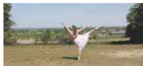
Cultuur maken we samen P4