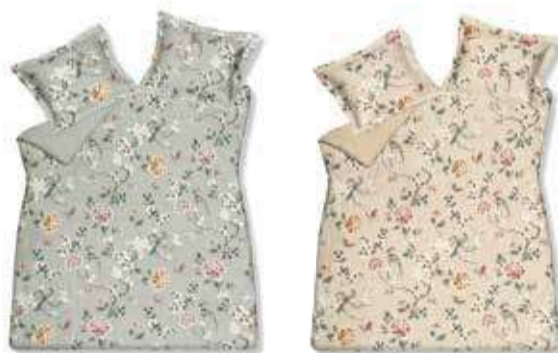
1. LIGHT GREEN