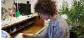
As het kunstenaarsje P8