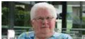
Een EigenWijs omaatje P3