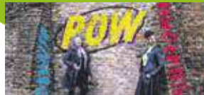
Internationale vrouwendag P11