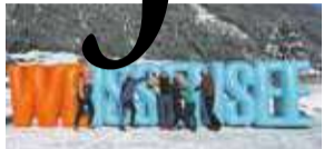
Zaterdag ijs in Nederland P9