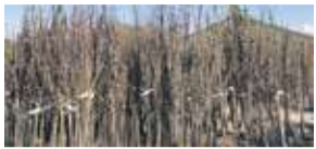
Het is weer planttijd! P7