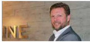
Comfortabel slapen? Ga naar van Beek Bedden P8