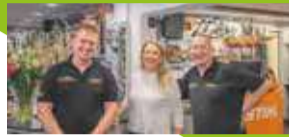
Osma Bos-, tuin- en parkmachines P10