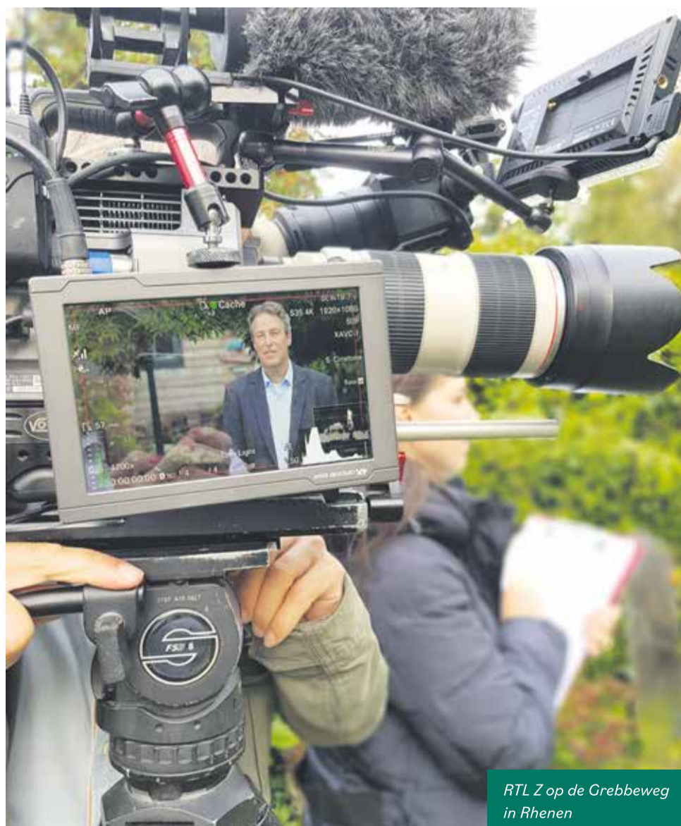
RTLZ op de Grebbeweg in Rhenen

Ook als u meer wilt weten over intensieve revalidatie bij chronische aandoeningen (bijvoorbeeld COPD, CVA, MS, Parkinson etc.) of voor en na een knie-of heupoperatie kunt contact met hen opnemen. Zij werken nauw samen met een Nederlandse revalidatiekliniek en internationaal ziekenhuis in het zuiden van Spanje.