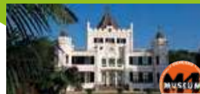
Kunstexpositie Land- goed Sandenburg P14

Gemeente Neder-Betuwe | Gemeente Rhenen Ingen | Lienden | Ommeren