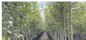
Tijd om te tuinieren! P9