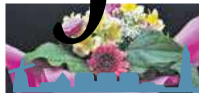
Bedankje aan... P10