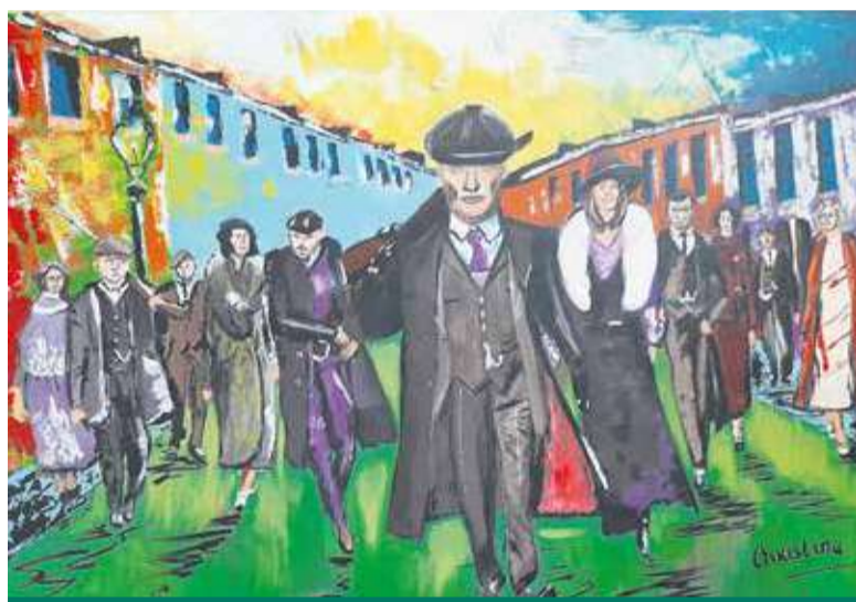
Peaky Blinders schilderij

Ik denk, dat wij wel wat van haar gaan horen. Er is nu al belangstelling voor haar werk.