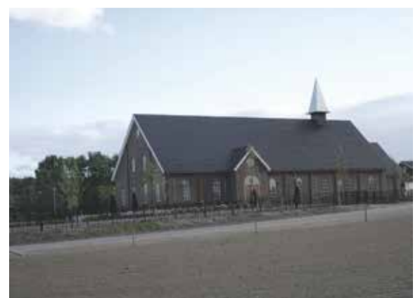
Nieuw kerkgebouw Oud Gereformeerde Gemeente in Nederland in Achterberg

D.V. zaterdag 5 september 2020 is het weer zover: De jaarlijkse fietstocht van de OGGIN te Achterberg! Er wordt een prachtige route uitgezet rondom het dorpje Achterberg, aan de voet van de Grebbeberg. Autowegen worden zoveel mogelijk vermeden waardoor u voornamelijk in de prachtige natuur fietst.