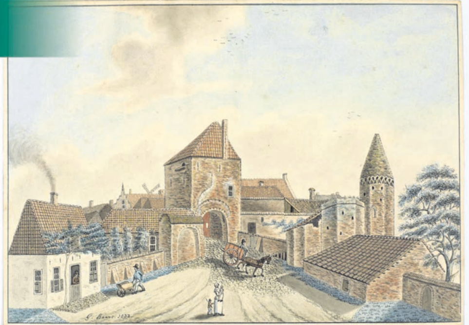
Een werk van Gijsbert Baars, reeds in de collectie.

Het verworven schilderij. Johannes Franciscus Christ, Gezicht op de Rijnpoort te Rhenen, ca. 1838, olieverf op paneel, 70 x 93 cm, rechtsonder gesigneerd (moeilijk leesbaar): 'J.F. Christ', Stadsmuseum Rhenen