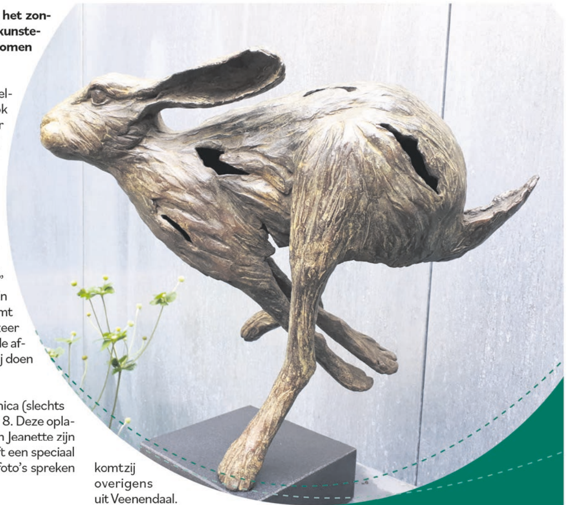
komt zij overigens uit Veenendaal.

Jeanette heeft al een kleine 70 exposities door het gehele land gehad. In het buitenland heeft zij ook diverse exposities mogen verzorgen. Ook dit jaar stonden er weer een aantal op de planning. Maar de coronacrisis heeft roet in het eten gegooid. Dit jaar doet zij mee aan de expositie op Landgoed Sandenburg op 4,5 en 6 september en Art Malden op 12 en 13 september. De bladen en de media weten ook de weg naar Rhenen te vinden. Reportages in Landleven, Hoefslag, De Tuin en de Gelderlander wisten haar al te strikken voor een interview. Ook in RTL programma Koffietijd heeft zij haar opwachting gemaakt. Het was dus tijd voor aandacht in deze regiokrant in haar eigen Rhenen. Oorspronkelijk