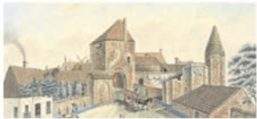
Stadsmuseum Rhenen P4 & P14