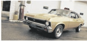
De Buurtgarage P5