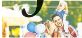
Lokale economie belangrijk P7